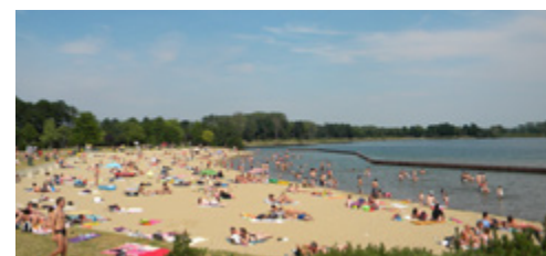
Provinciaal Recreatiedomein De Nekker