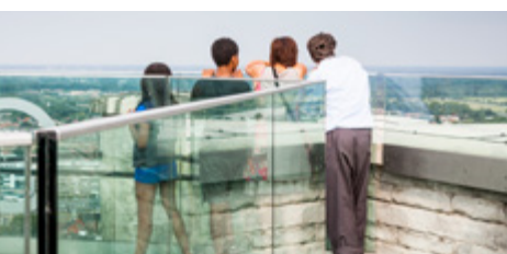
Skywalk Sint-Romboutstoren, Mechelen