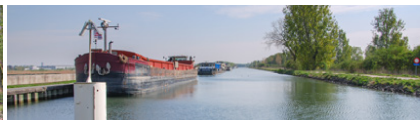
Kanaal Leuven - Dijle